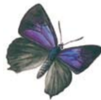
Eksnabbvinge ( Favonius quercus ).

Du bjuds alldeles oavsett räknasätt på en vacker vy över landskapet.