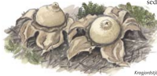
Kragjordstjärna ( Geastrum triplex ). En sällsam och sällsynt svamp.

Den ovanliga alliansen mellan kalkmark och barrskog lockar fram flera sällsynta svampar. De kanske märkligaste kallas för jordstjärnor. Jordstjärnorna påminner först om en hård lök, men spricker och antar formen av en stjärna. Svampen reser sig sedan på sina stjärnflikar och blottar fruktkroppen i hopp om att hårt väder ska sprida sporer på all världens väg.