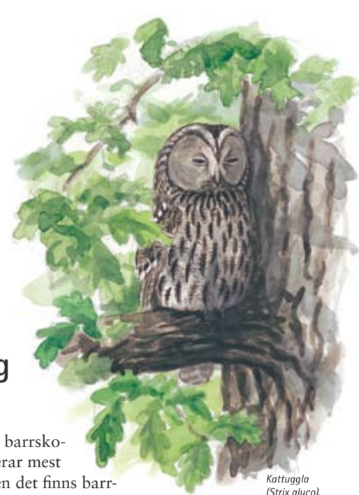
Kattuggla ( Strix aluco ).

För dig som vill vandra i barrskogar erbjuds goda möjligheter vid Hönsäters sjöskog, Gröne skog, Råbäck, Råbäcksk sjöskog, Hellekis och Säten. De speciella kalkbarrskogarna hittar du vid Säten, Hönsäter och Gröne skog.