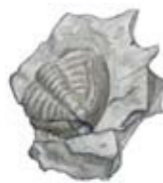
Tillblib. Det här djuret, fångat i ett avtryck i kalkstenen, levde i havet för långesen.

Idag ses fortfarande spåren efter en senare industri - kalkbränningen.